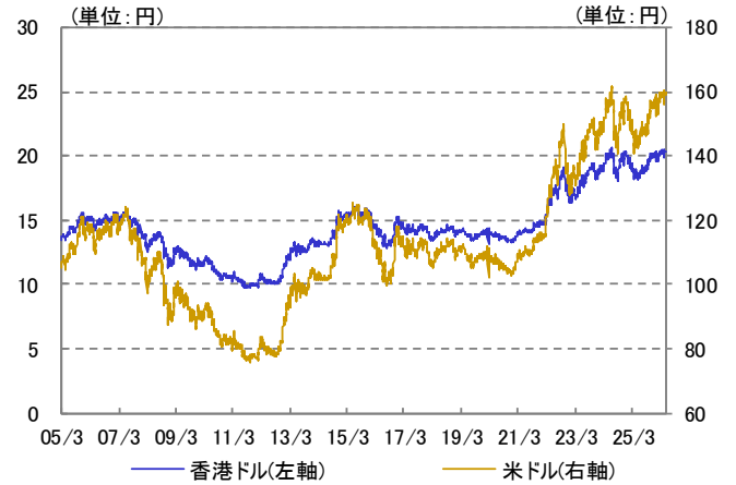
主要通貨の推移(対円) 2005/03/22~2026/05/29