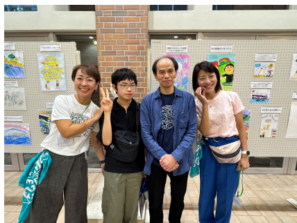
かつてコモンズ賞を受賞したお子さんとそのお父さまと

そして、10月4日（土）に開催したコモンズ社会起業家フォーラムにて、すべての作品を展示させていただきました。応募してくださった親子が見に来てくれたり、うれしい再開も。