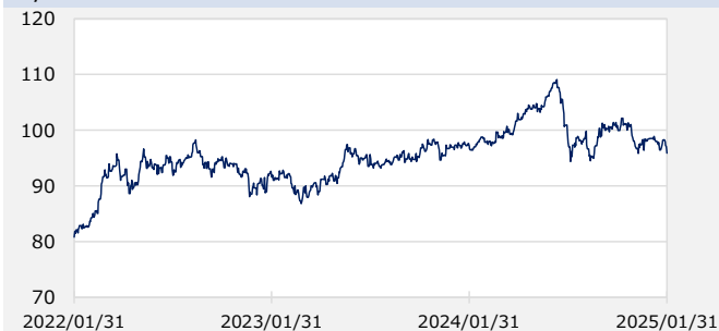
円/オーストラリアドル（円）