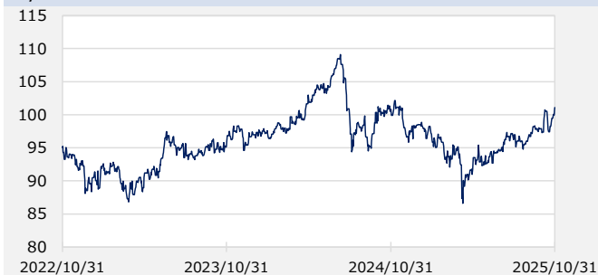
円/オーストラリアドル（円）