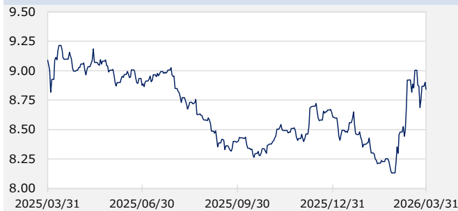
FTSE WGBIメキシコ国債 最終利回り（%）