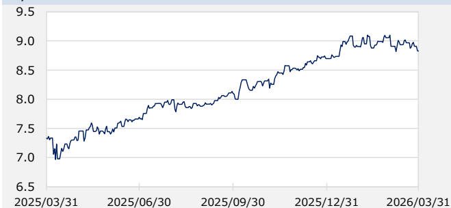
円/メキシコペソ（円）