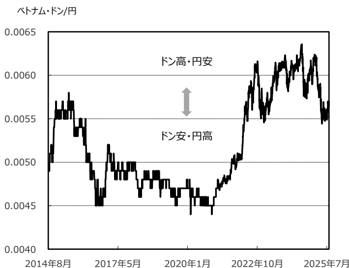
ベトナム・ドン/円の対円レート推移 (2014/8/20 ~ 2025/7/31)