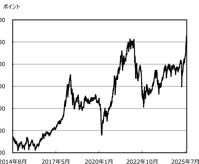
ベトナムVN指数 (2014/8/20 ~ 2025/7/31)