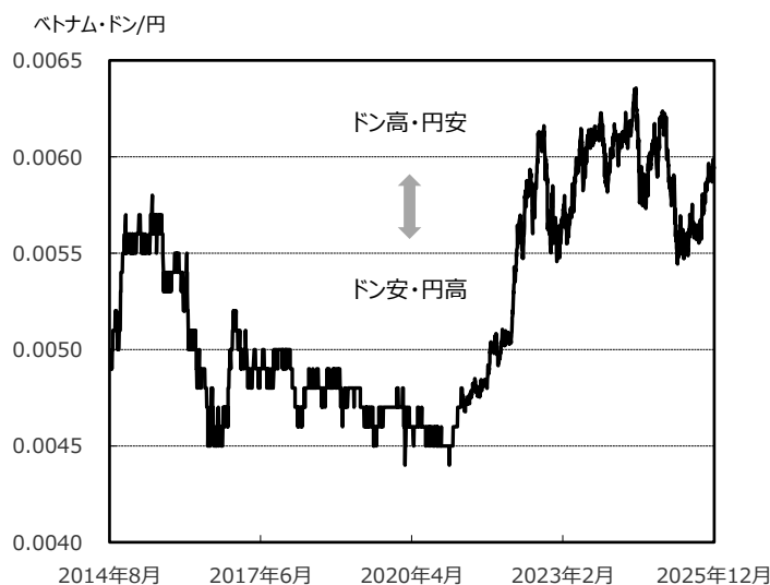
ベトナム・ドン/円の対円レート推移 (2014/8/20 ~ 2025/12/30)