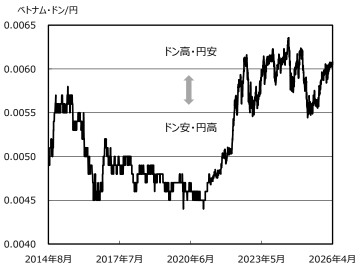
ベトナム・ドンの対円レートの推移 (2014/8/20 ~ 2026/4/30)