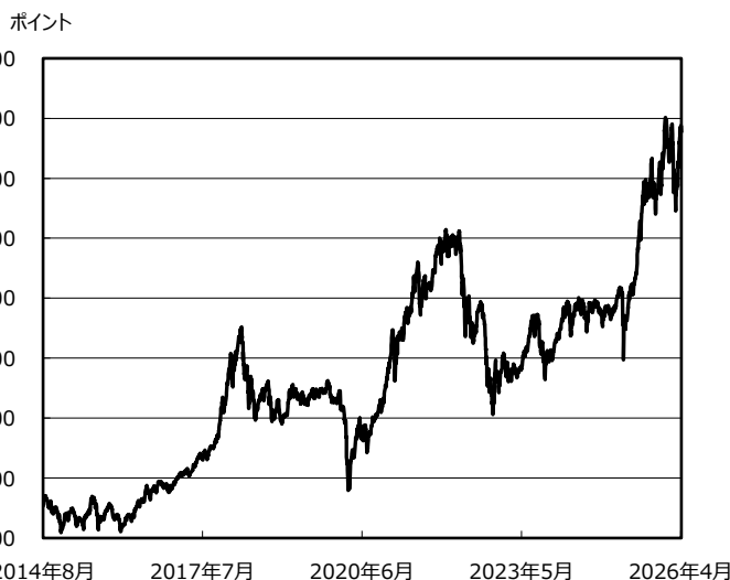
ベトナムVN指数 (2014/8/20 ~ 2026/4/30)