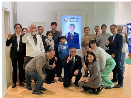
共振館にある高原社長のパネルの前で記念撮影

文字通り、共振館を訪れた人の心が共に響き合う（共振する）ことを目的とした、創業者の想いを「全身で感じて、持ち帰る」ための場所なのです。