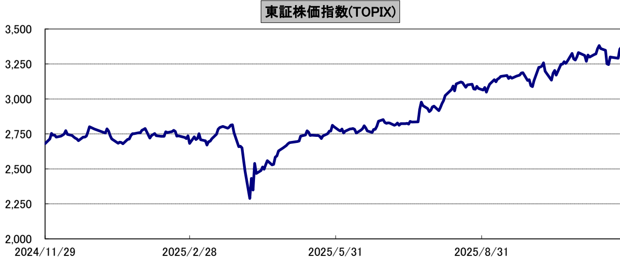
東証株価指数(TOPIX)の推移