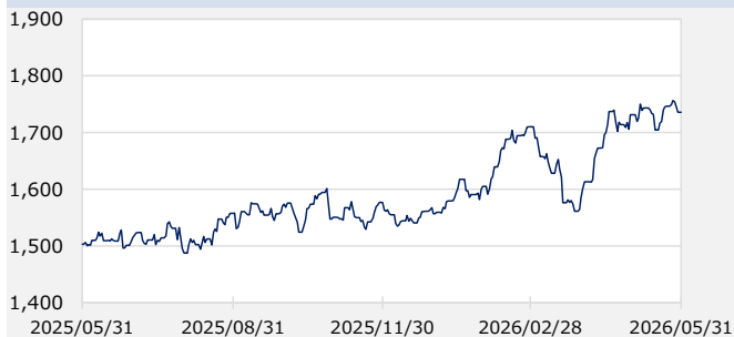
S&P先進国REIT指数（除く日本、配当込み）