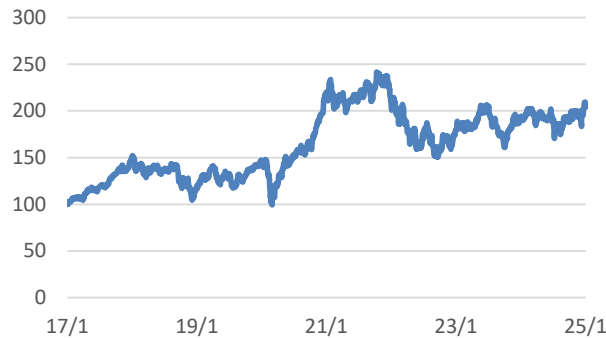
ROBO Global Robotics and Automation UCITS指数 (税引後配当込み、円ヘッジあり、円ベース)