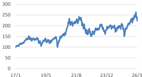
ROBO Global Robotics and Automation UCITS指数 (税引後配当込み、円ヘッジあり、円ベース)