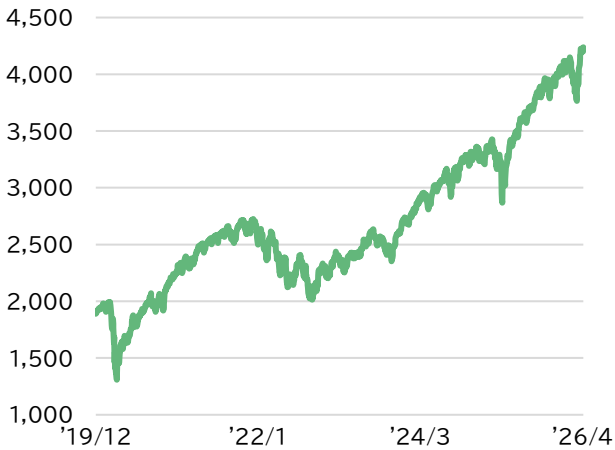
■ MSCI ACWI ex JAPAN(配当込み)(米ドルベース)の推移