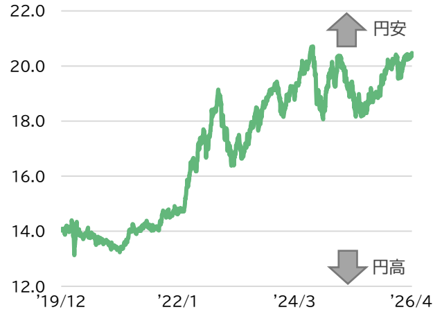
■ 香港ドル/円の推移