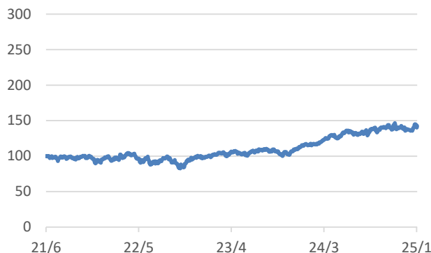
ファクトセット・グローバル・エクステンデッド・スペース・インデックス（配当込み、円ヘッジあり、円ベース）