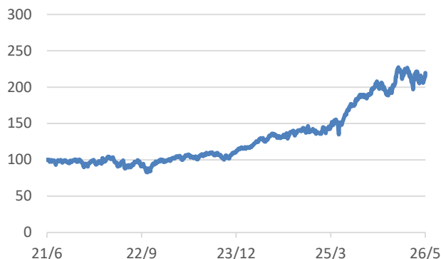
ファクトセット・グローバル・エクステンデッド・スペース・インデックス（配当込み、円ヘッジあり、円ベース）