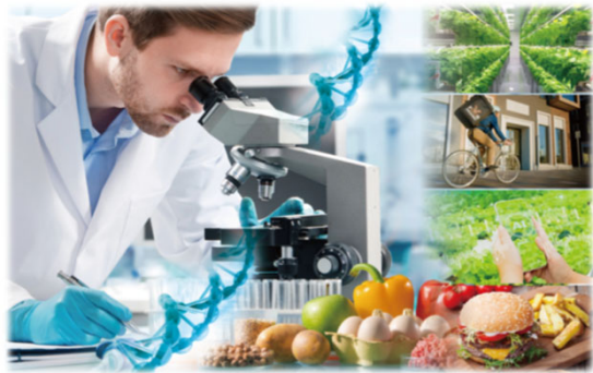
図表2：フードテック = 食 × テクノロジー

フードテック (FoodTech) とは、食 (Food) とテクノロジー (Technology) を融合させ、イノベーションを発生させることで、巨大な食料問題を解決する新たなビジネス領域です。