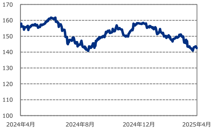
■ 米ドル/円の推移 (円)