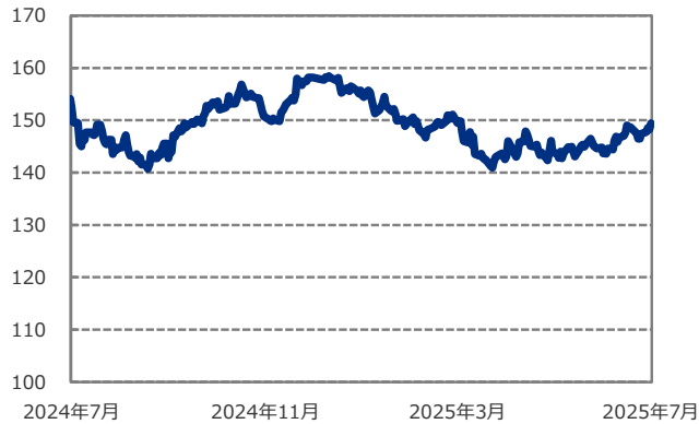
■ 米ドル/円の推移 (円)