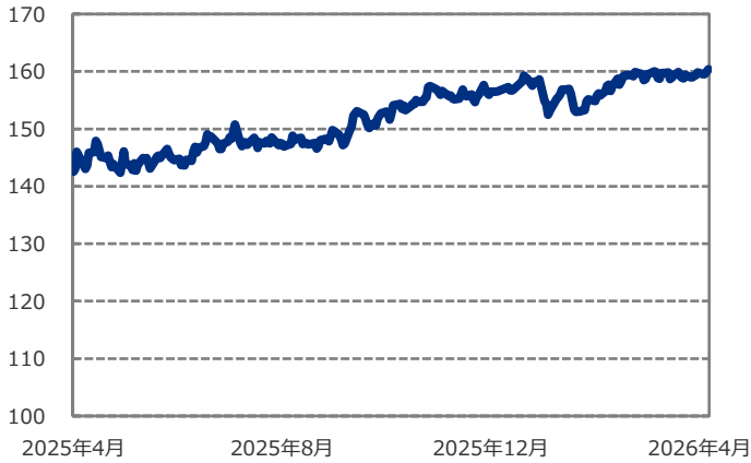
■ 米ドル/円の推移 (円)