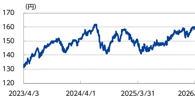
為替（米ドル・円レート）の推移（直近3年間）