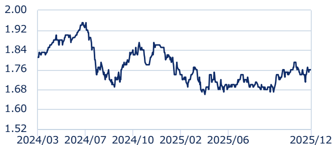
インドルピー/円レート