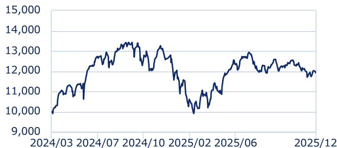
BSE 250 SmallCap インデックス

・上記指数は配当込み、インドルピーベースです。設定時を10,000として指数化しています。後記の「当資料で使用している指数について」をあわせてご覧ください。