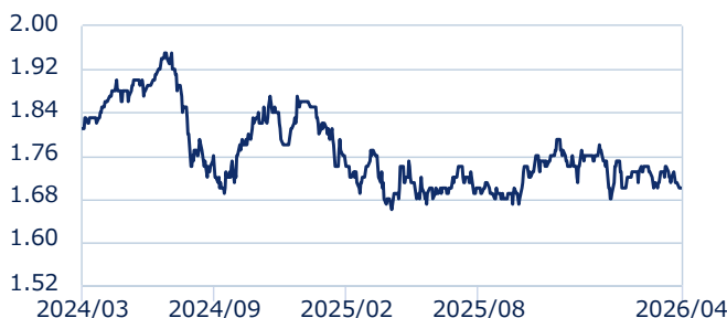
インドルピー/円レート