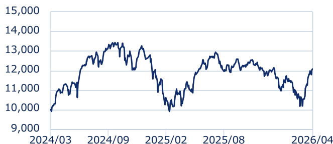
BSE 250 SmallCap インデックス

・上記指数は配当込み、インドルピーベースです。設定時を10,000として指数化しています。後記の「当資料で使用している指数について」を合わせてご覧ください。