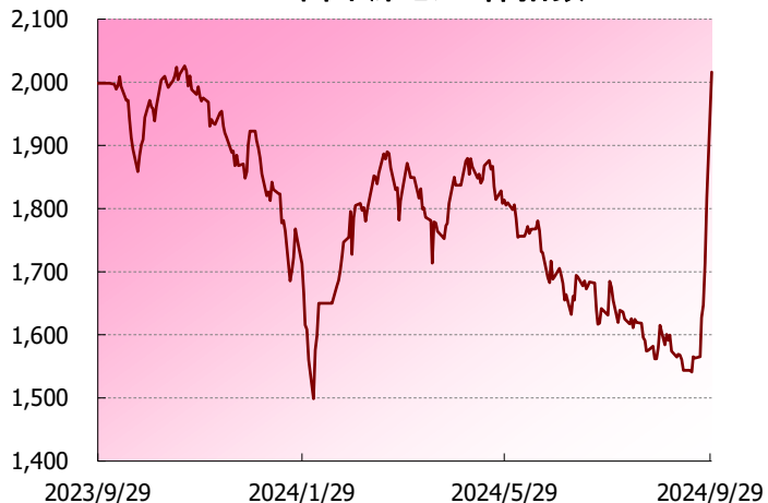
中国 深センA株指数