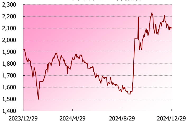
中国 深センA株指数