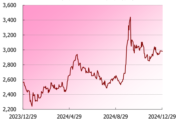
香港 ハンセン総合指数