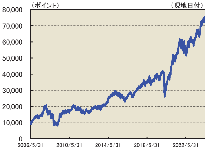
為替(インドルピー/円)の推移 (2006年5月31日～2024年5月31日)