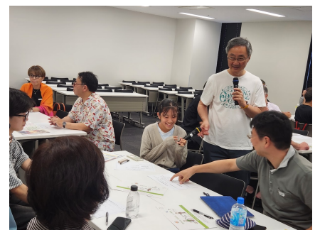
対話セッション後の共有タイム