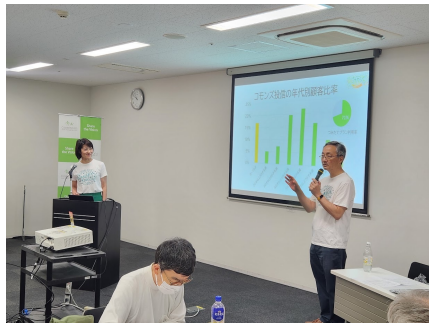
渋澤から15年の振り返り

ご参加いただいた約40名のお仲間（コモンズ投信のお客さま）と、未来について対話しました。