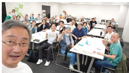
ご参加の皆様との集合写真

このつどいは、今後もまだまだ続きます！コモンズのメンバーもたくさん参加しますので、ぜひ、皆さまお近くで開催の際はぜひご参加ください！