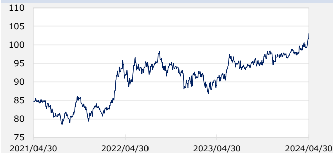
円/オーストラリアドル（円）