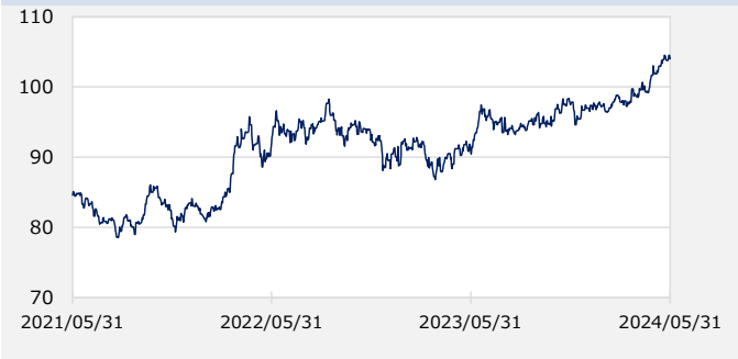
円/オーストラリアドル（円）