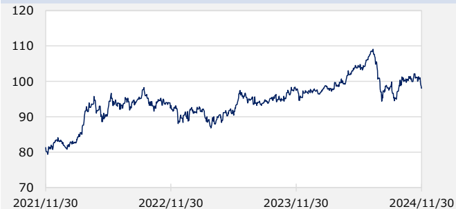
円/オーストラリアドル（円）