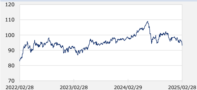
円/オーストラリアドル（円）