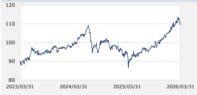
円/オーストラリアドル（円）