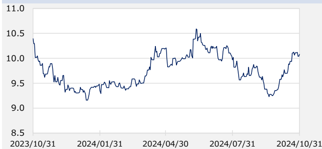
FTSE WGBIメキシコ国債 最終利回り（%）