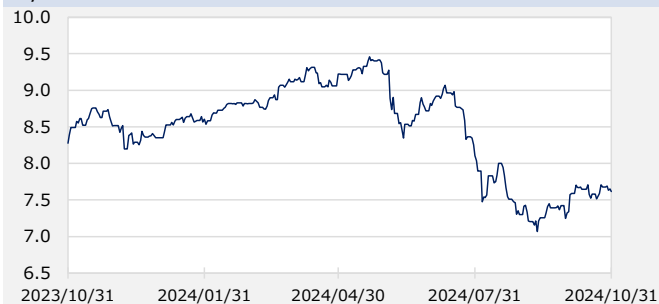
円/メキシコペソ（円）