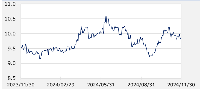
FTSE WGBIメキシコ国債 最終利回り（%）