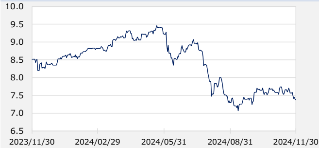
円/メキシコペソ（円）