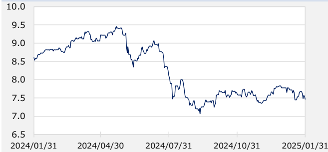
円/メキシコペソ（円）