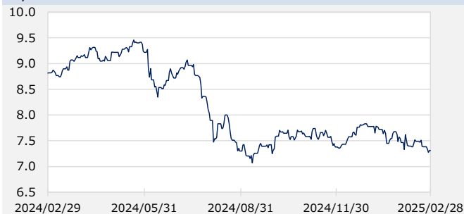
円/メキシコペソ（円）