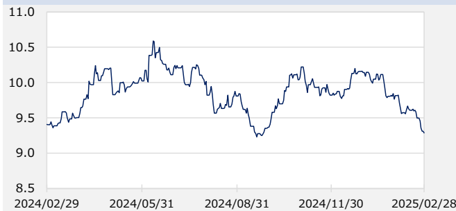
FTSE WGBIメキシコ国債 最終利回り（%）