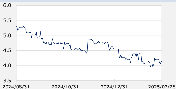
アメリカドルヘッジコスト (%)