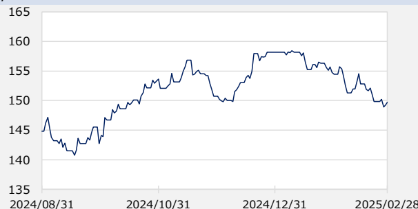
円/アメリカドル (円)