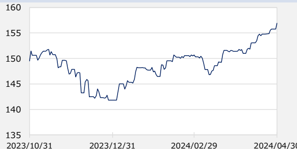
円/アメリカドル（円）