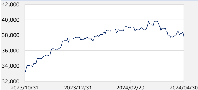
ダウ・ジョーンズ工業株価平均