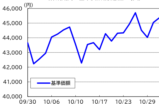
当作成期間の基準価額(分配落)の推移