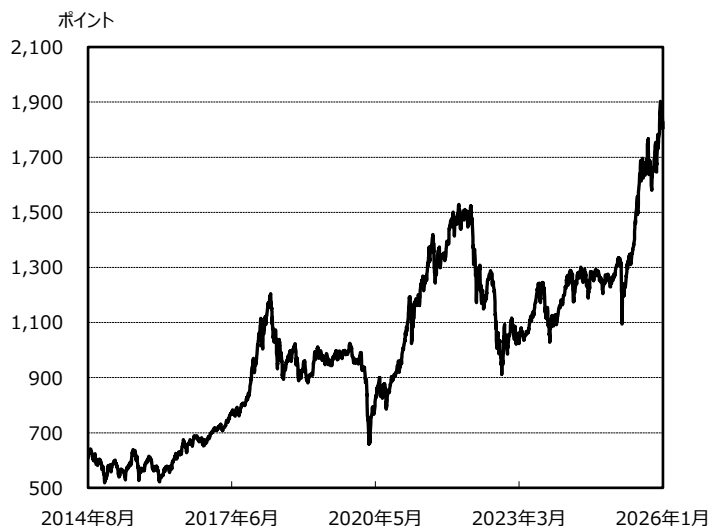
ベトナムVN指数 (2014/8/20 ~ 2026/1/30)