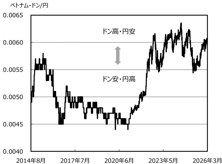
ベトナム・ドンの対円レートの推移 (2014/8/20 ~ 2026/3/31)