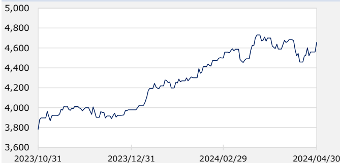
TOPIX（東証株価指数、配当込み）