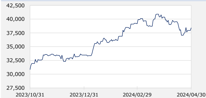
日経平均株価（日経225）（円）