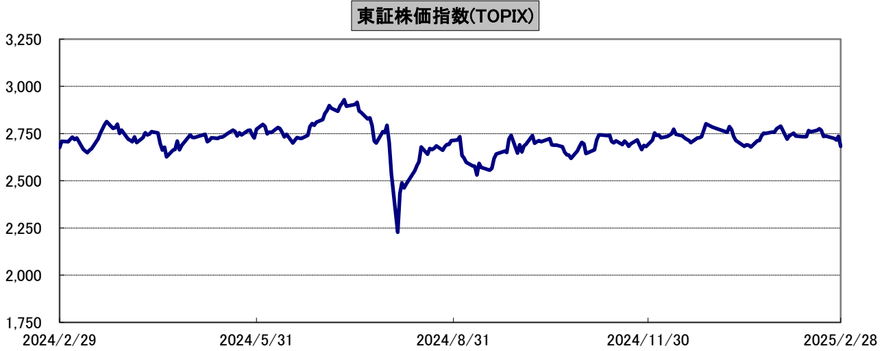
東証株価指数(TOPIX)の推移