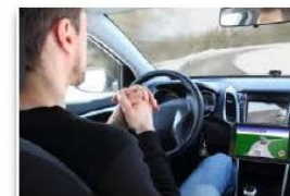
運転の自動(自律)化