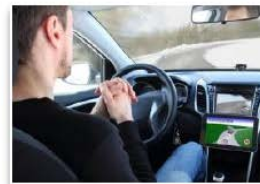
運転の自動(自律)化