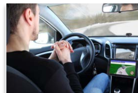
運転の自動(自律)化