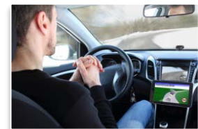
運転の自動(自律)化