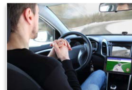
運転の自動(自律)化