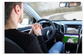
運転の自動(自律)化