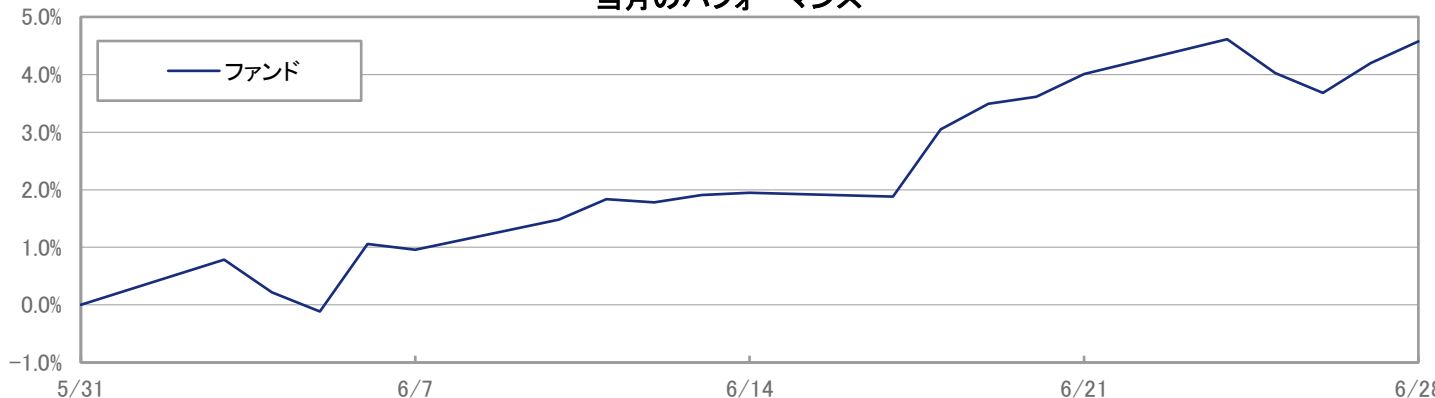
当月のパフォーマンス

※ 上記のグラフは過去のものであり、将来の運用成果を保証するものではありません。